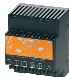
CP SNT 48W 24VDC 2A