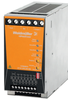
CP DC UPS 24V 40A